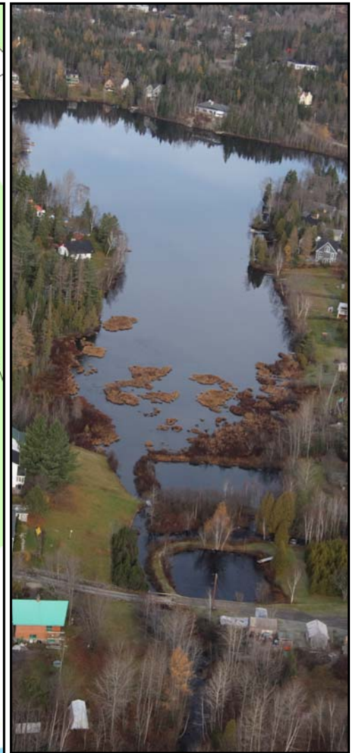
Lac Clément, Pierre Nadeau, APEL, 2007

Suite aux résultats de l'étude, plusieurs actions peuvent être entreprises dans le but d'améliorer la condition générale du lac. Premièrement, le recouvrement des murets et des enrochements avec de la végétation ainsi que la renaturalisation des rives à l'aide d'espèces endémiques devraient être effectués sur l'ensemble des rives du lac. Ces actions contribuent à freiner l'érosion des berges, à créer un écran solaire ainsi qu'à diminuer les apports en sédiments, en éléments nutritifs et en contaminants vers le lac. De plus, il serait impératif de diminuer l'usage de sels de déglacage et d'instaurer des méthodes de récupération des abrasifs avant qu'ils ne parviennent aux cours d'eau. L'acquisition de connaissances supplémentaires sur le lac Clément serait nécessaire afin de statuer sur son état et son avenir (nature et source de l'eau profonde fortement chargée).